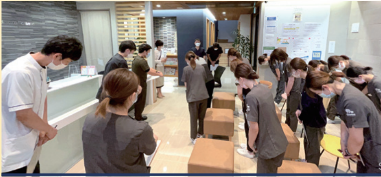
患者対応ワークを交えた実践型の研修